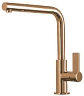
Mitigeur Omega Copper